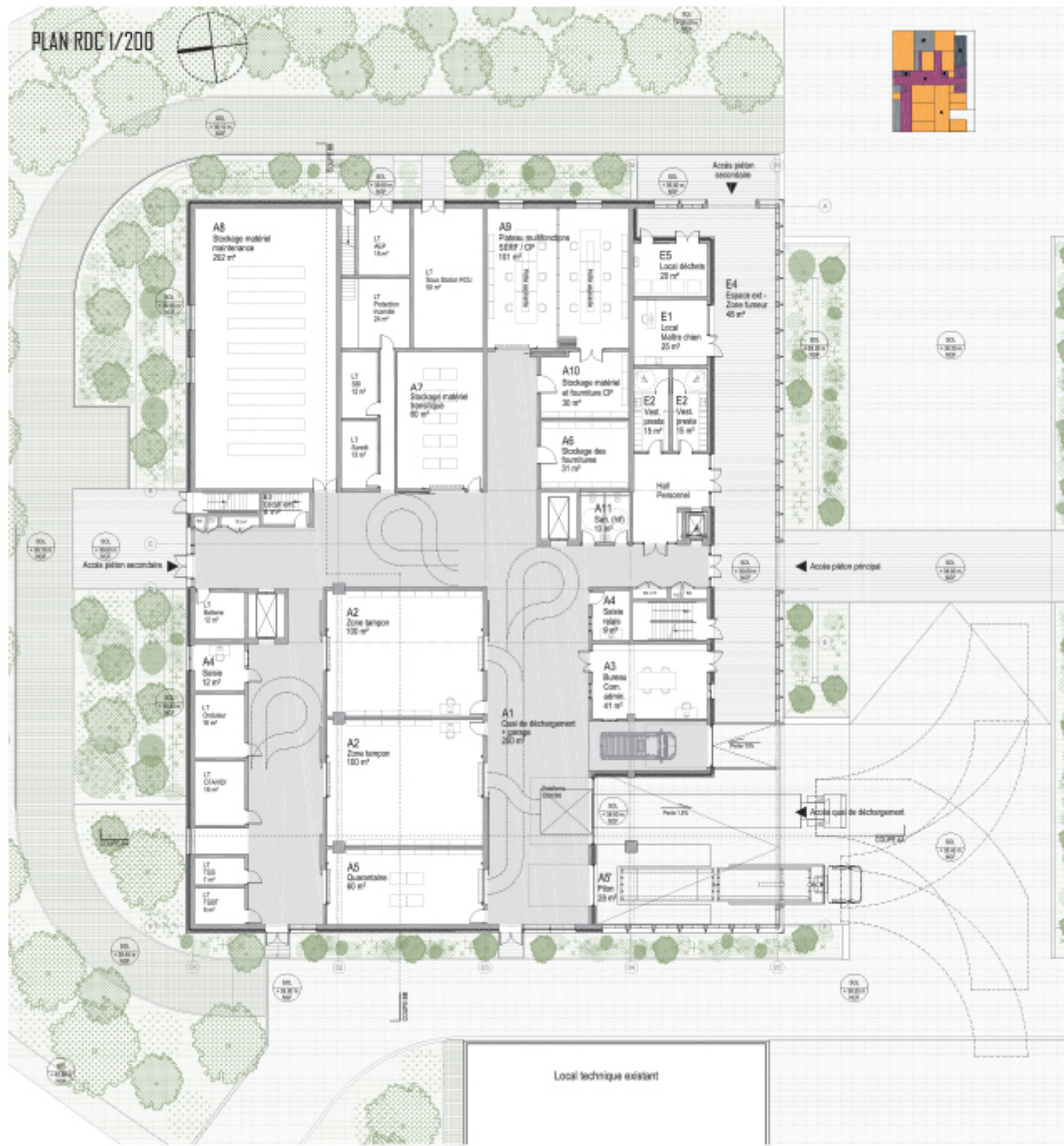
PLAN RDC 1/200