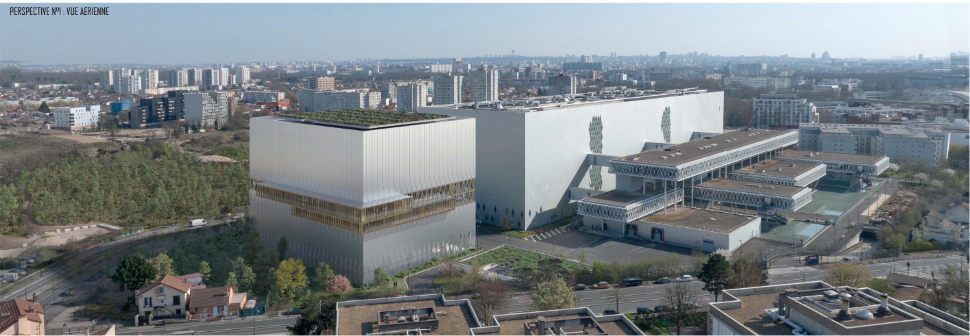
PERSPECTIVE N°1 : VUE AERIENNE